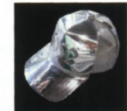
#400磨き(技能フェア出品)